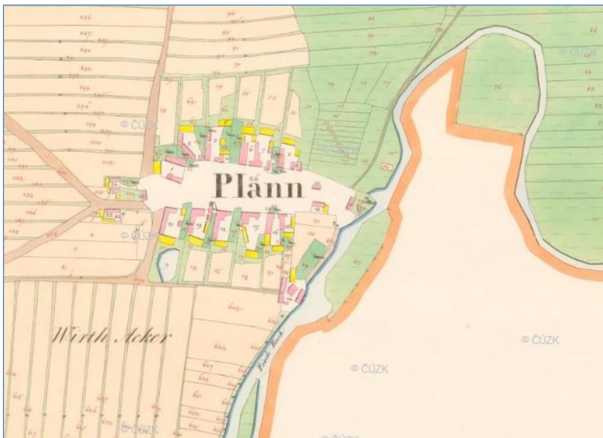
výřez z císařských povinných otisků stabilního katastru z roku 1827