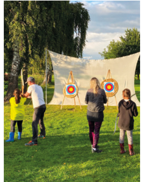
Ukončení léta - lukostřelba