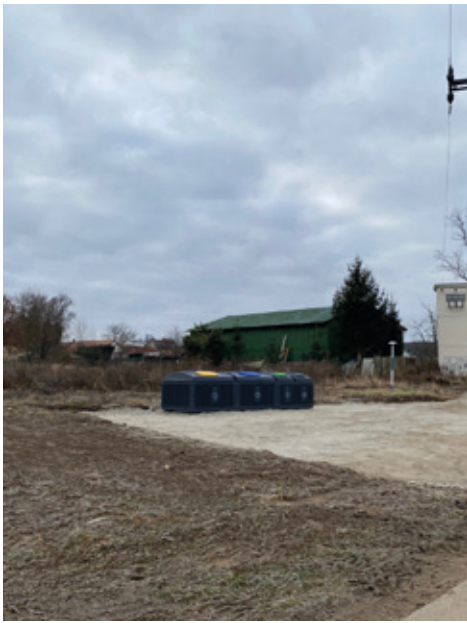
Nové kontejnery na tříděný odpad