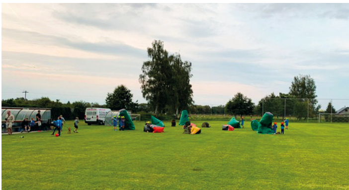
Laser game – dětský den