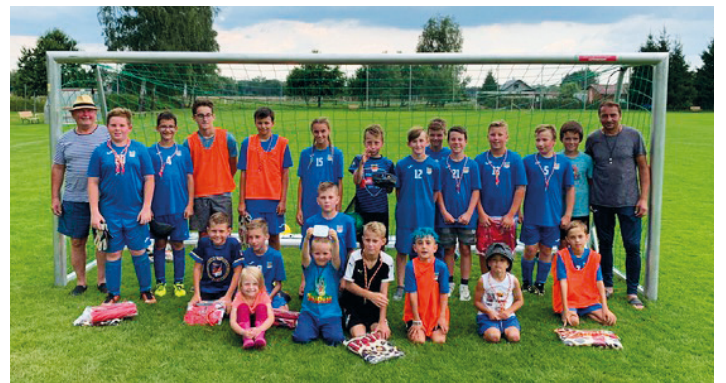
SK Planá – tréninkový kemp