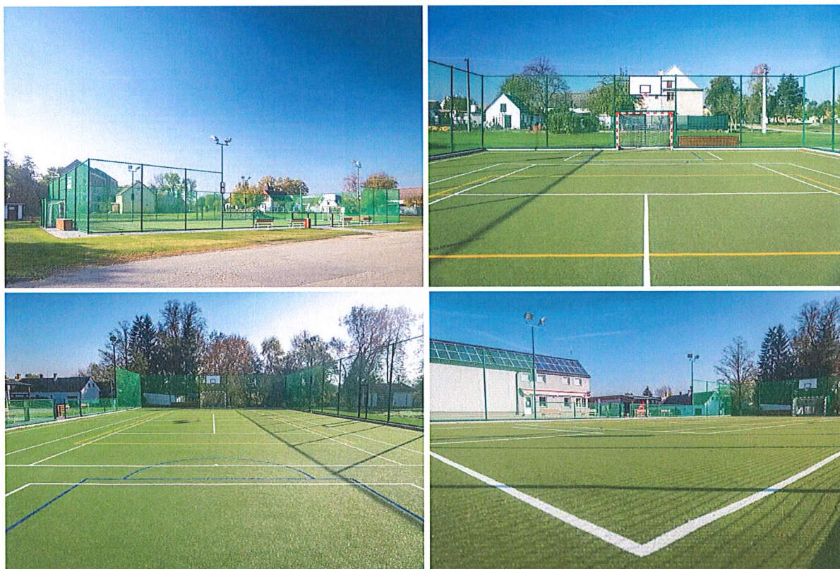
Fotografie č.1: Víceúčelové sportovní hřiště